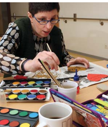
Besonders beliebt: Kreatives Gestalten und gemeinsame Spiel- und Freizeitaktivitäten werden regelmäßig angeboten.