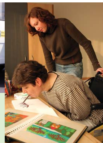
Ein Haus zum Wohlfühlen: Die komplett behindertengerechte Ausstattung und helle, freundliche Einzelzimmer sorgen für optimale Wohnbedingungen.