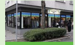
Diakonieladen Mitte Gerlingstraße 41