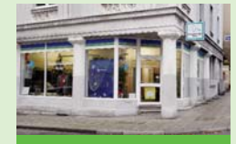
Diakonieladen Kray Leitherstraße 15