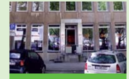
Church: Restaurant und Depot III. Hagen 39