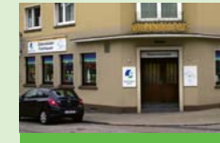
Diakonieladen Frohnhausen Frankfurter Straße 1