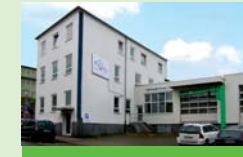
Möbelbörse Hoffnungstraße 22