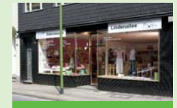
Diakonieladen Lindenallee Lindenallee 84