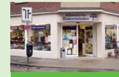
Altendorfer Diakonieladen Altendorfer Straße 361

Mit dem Kooperationspartner Neue Arbeit der Diakonie Essen gGmbH: