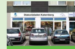
Diakonieladen Katernberg Schonnebeckhöfe 235