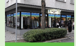
Diakonieladen Mitte Gerlingstraße 41