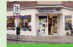
Altendorfer Diakonieladen Altendorfer Straße 361

Mit dem Kooperationspartner Neue Arbeit der Diakonie Essen gGmbH: