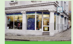
Diakonieladen Kray Leitherstraße 15