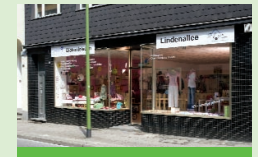
Diakonieladen Lindenallee Lindenallee 84