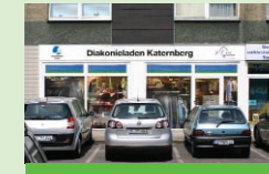
Diakonieladen Katernberg Schonnebeckhöfe 235