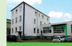
Möbelbörse Hoffnungstraße 22