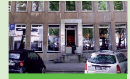
Church: Restaurant und Depot III. Hagen 39

Mit dem Kooperationspartner Neue Arbeit der Diakonie Essen gGmbH: