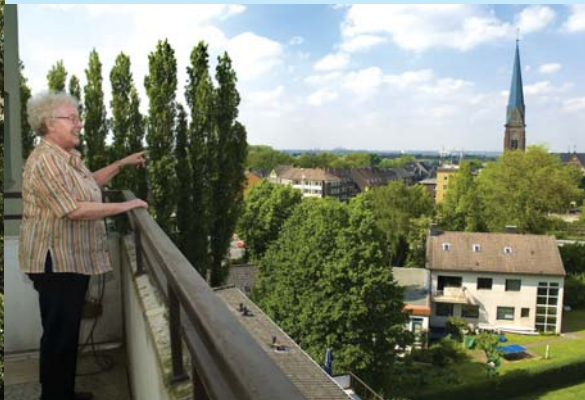
Wunderschöne Aussicht: Viele Bewohnerinnen und Bewohner genießen den Blick weit über die Stadtgrenzen hinaus.

Verkehrsgünstig im attraktiven Essener Stadtteil Kray gelegen, bietet Ihnen das Altenzentrum Kray eine angenehme Wohn- und Pflegeeinrichtung mit einer Vielzahl seniorengerechter Angebote.