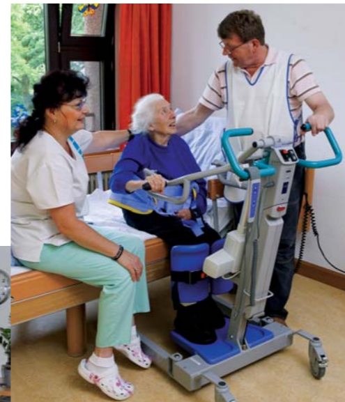
Beste Betreuung: Pflegebedürftige Menschen werden rund um die Uhr individuell versorgt.