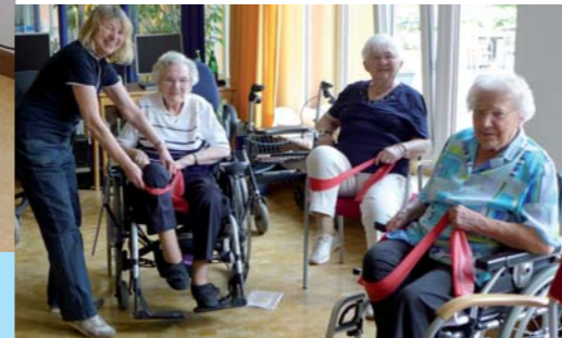
Vielfältige Freizeitangebote: Bei professionellen Sport- und Bewegungsangeboten kommt viel Freude auf.