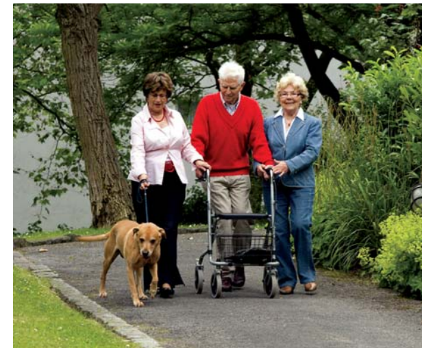
Zwischen Gruga-Park und Gartenstadt: Das Seniorencentrum verfügt über ein attraktives Außengelände.

Umgeben von einer großzügigen und in sich geschlossenen Parkanlage erwartet Sie in unserer Einrichtung ein vielfältiges Angebot mit hauseigenem Café und Kiosk, einem Friseur-Salon und einer Physiotherapie-Praxis mit Krankengymnastik und Fußpflege.