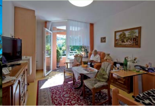
Je nach dem eigenen Geschmack können die Apartments völlig individuell eingerichtet werden.